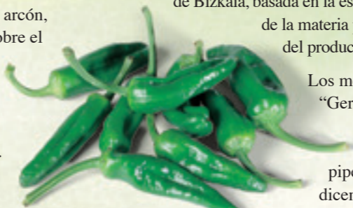
Pimientos de Gernika

El pimiento de Gernika, justamente frito, es uno de los placeres supremos de la cocina de Bizkaia, basada en la esencia de la materia prima del producto.