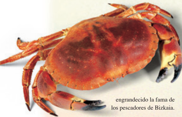
Buey de mar

D ejando atrás la zona de influencia de la villa de Bilbao, nos acercamos a la costa y a los puertos que han